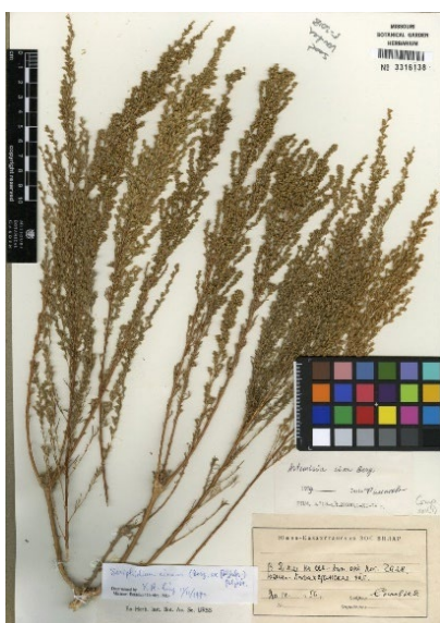
Figura 1: Seriphidium cinum .

Fonte: Trópicos [3] . Autoras: Karen Berenice Denez, Adriana Nunes Wolffenbüttel.